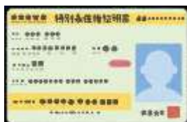
特別永住権証明書