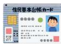
住民基本台帳カード